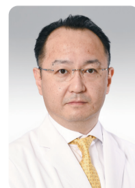
監修：木村 高弘先生 東京慈恵会医科大学附属病院 泌尿器科 教授、診療部長

羞恥心や年齢に対する諦め、治療への恐怖心が壁になっているようです。悩む前に、専門医に相談しましょう。考えているよりずっと負担の少ない治療法が見つかるはずです。