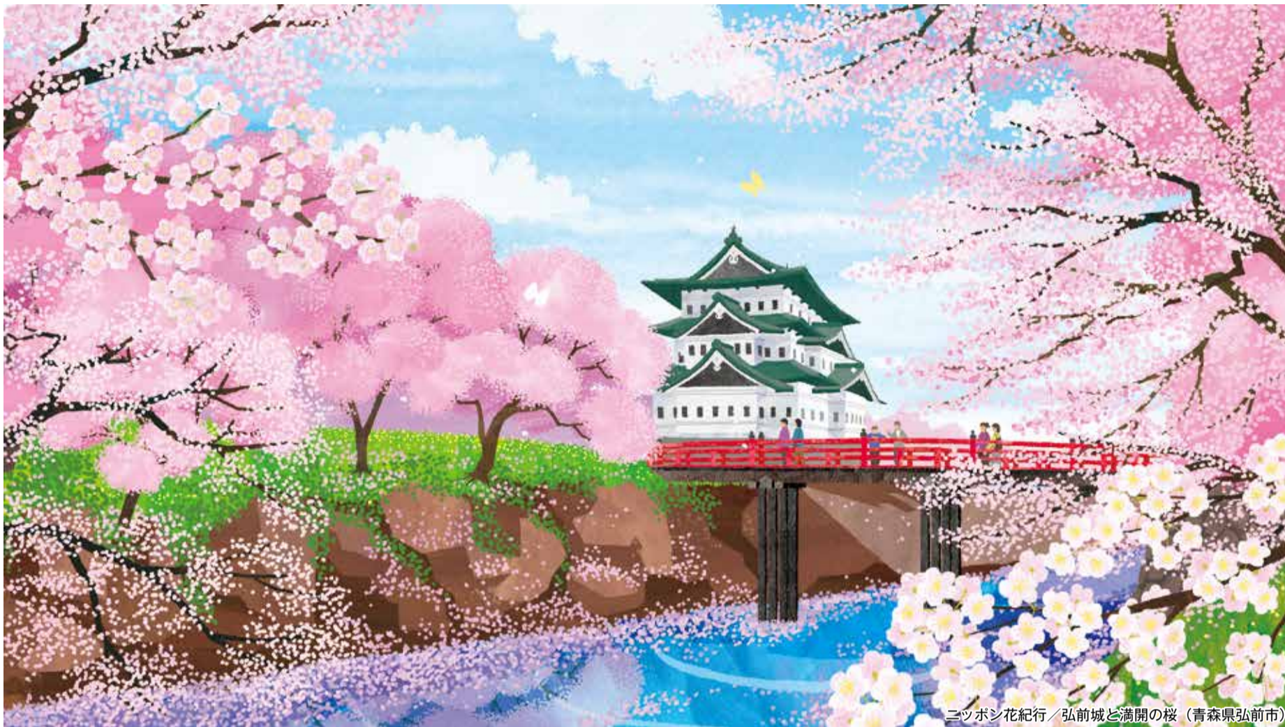
ニッポン花紀行 / 弘前城と満開の桜 (青森県弘前市)